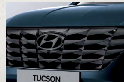
Lưới tản nhiệt dạng tham số

Gạt bỏ những định kiến thông thường, TUCSON hoàn toàn mới xóa nhòa ranh giới của phân khúc và tạo nên những chuẩn mực mới. TUCSON sở hữu thiết kế ấn tượng, với phần nội thất rộng rãi, linh hoạt, thoải mái vượt qua sự mong đợi của bạn.