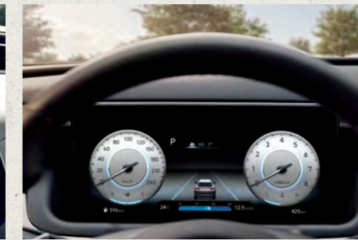
Màn hình thông tin digital 10.25 inch (Bản Đặc Biệt và Turbo)