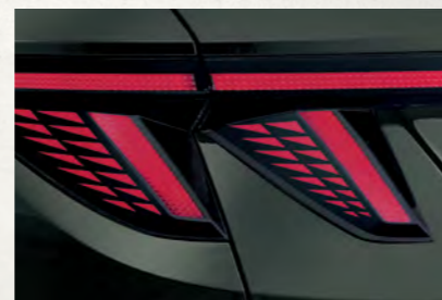
Cụm đèn hậu công nghệ LED

Tiên phong với thiết kế đèn ban ngày dạng ẩn giúp định hướng phong cách Sensuous Sportiness cho Tucson hoàn toàn mới.