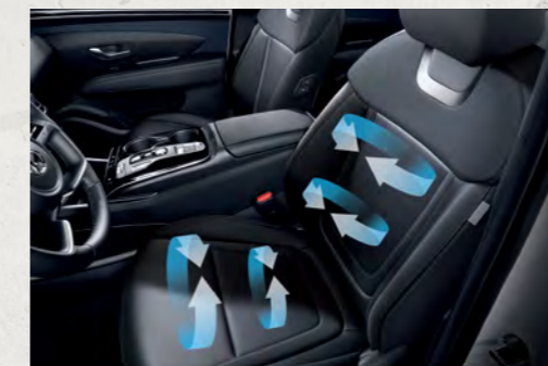
Làm mát và sưởi hàng ghế trước