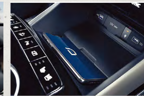
Sạc không dây chuẩn Qi (Bản Đặc Biệt và Turbo)