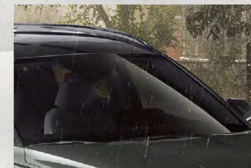
Gạt mưa tự động