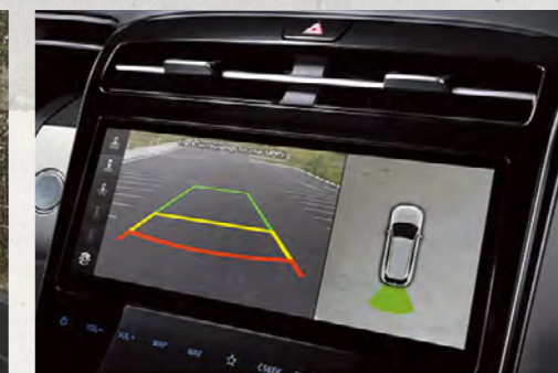
Hệ thống camera 360° (Bản Đặc Biệt và Turbo)