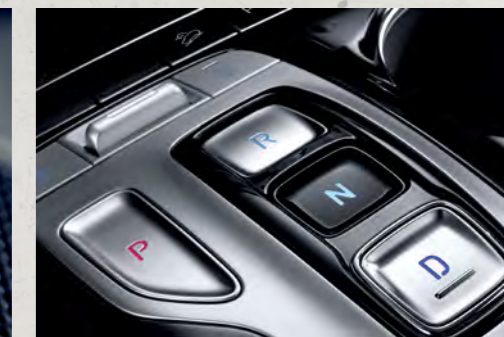
Cần số điện tử dạng nút bấm (Bản Dầu Đặc Biệt và Turbo)