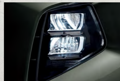
Đèn chiếu sáng LED (Phiên bản Đặc biệt/Turbo)