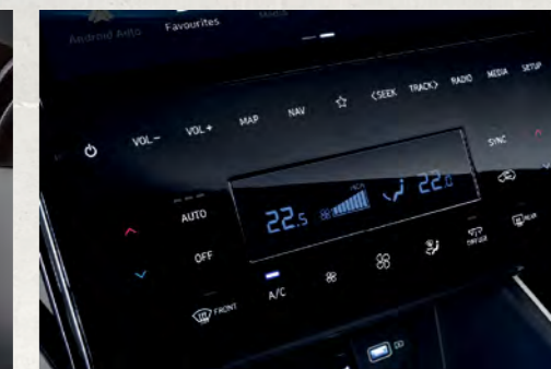
Điều hòa tự động 2 vùng độc lập