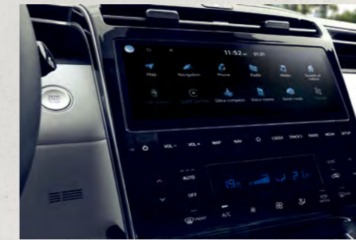
Màn hình giải trí 10.25 inch

TUCSON mang đến sự thoải mái tối đa bằng không gian mở rộng rãi cùng các tiện ích hàng đầu phân khúc