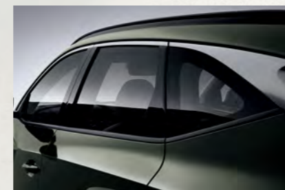
Thiết kế dạng mui bay với phần ốp Chrome