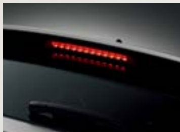
Đèn phanh trên cao