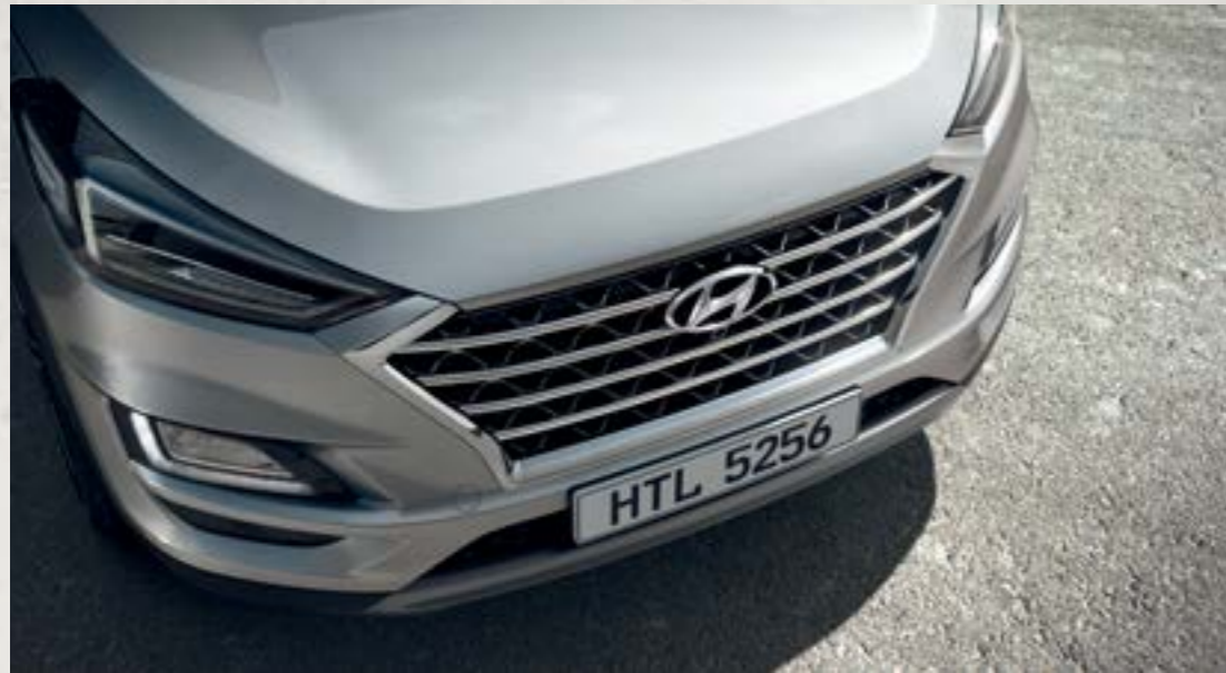
Lưới tản nhiệt dạng thác nước Cascading Grill ấn tượng