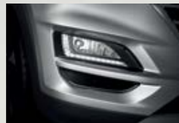
Dải đèn LED ban ngày sắc sảo