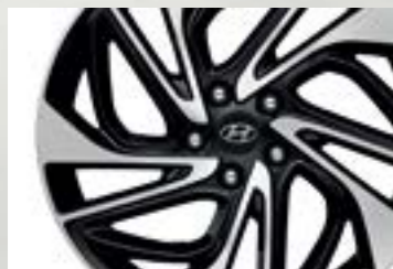
Lazang hợp kim 19 inch thể thao