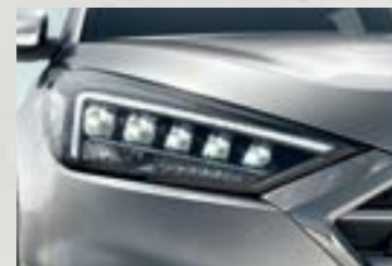
Cụm đèn pha Full LED mạnh mẽ