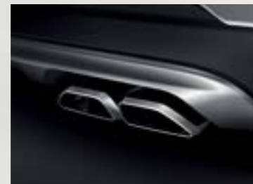
Ống xả kép