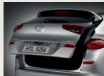
Cốp điện thông minh